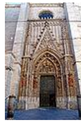
Puerta de San Miguel.