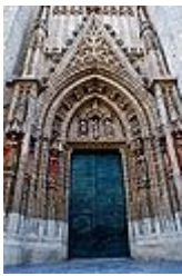
Portada del Bautismo.