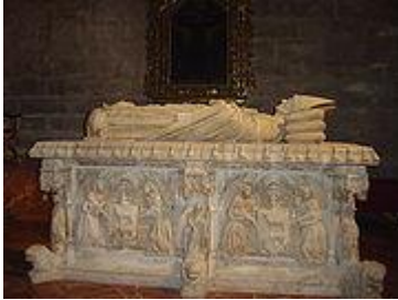
Sepulcro del Cardenal Cervantes.

Este fue el lugar elegido por el Cardenal Juan de Cervantes para descansar eternamente. El Cardenal Cervantes nació en Lora del Río, (Sevilla), en el año 1382 y fue obispo de la ciudad durante 5 años, desde 1449 hasta el 25 de noviembre de 1453. Lorenzo Mercadante de Bretaña labró en 1458 el magnífico sepulcro gótico realizado en alabastro blanco que podemos contemplar en la actualidad y estampó su firma " Lorenzo Mercadante de Bretaña entallo este bulto ". En la parte frontal destaca el escudo de armas del cardenal sostenido por ángeles, arriba la estatua yacente de un enorme realismo sobre un catafalco.