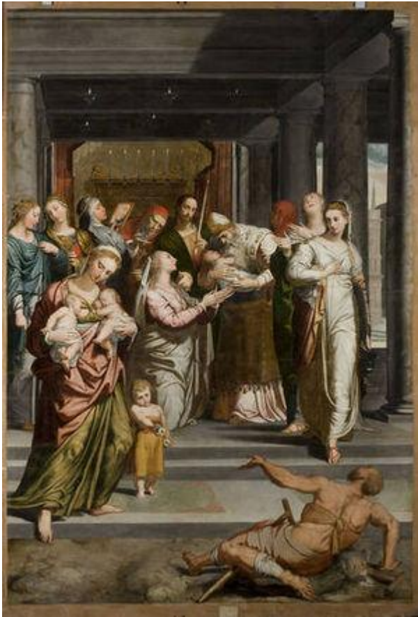
La Purificación de la Virgen de Pedro de Campaña.