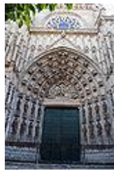
Portada principal o de la Asunción.