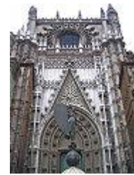
Portada del Príncipe.