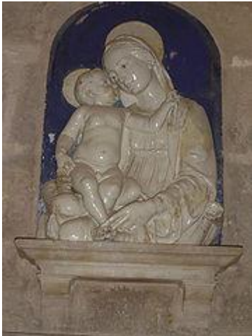
Virgen del Cojín.

Lo primero que llama la atención de esta capilla es un cuadro de grandes dimensiones pintado por Juan de Roelas en 1609 en el que se representa a Santiago combatiendo contra los musulmanes en la Batalla de Clavijo, donde según la tradición su apoyo fue fundamental para que las tropas cristianas logaran la victoria. El lienzo se encuentra enmarcado en un retablo realizado por Bernardo Simón de Pineda en 1663. En la parte superior del mismo se sitúa una pintura dedicada al martirio de San Bartolomé, obra de Juan de Valdés Leal fechada en 1663.