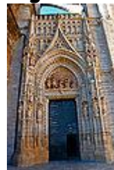
Puerta de Palos.