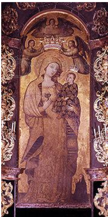
Virgen de la Antigua.

Según la leyenda, antes de la conquista de Sevilla por los cristianos, un ángel condujo al Rey San Fernando al interior de la mezquita principal de la ciudad, donde detrás de un muro que se hizo transparente, pudo ver la imagen de la Virgen de la Antigua que permanecía allí oculta desde hacía siglos, pocos días después se rindieron las fuerzas musulmanas y San Fernando entró triunfante en la ciudad el 22 de diciembre de 1248.