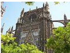
Portada de la Concepción.