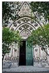
Portada de la Concepción.