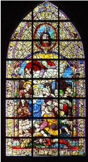
Vidriera de La Adoración de los Pastores