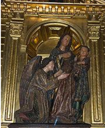
Altar de la Virgen del Madroño.