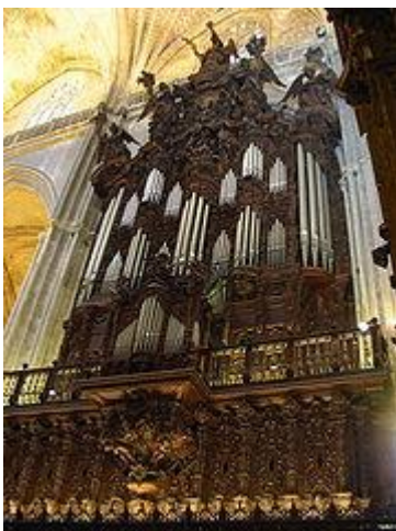
Órgano en el interior de la catedral de Sevilla.