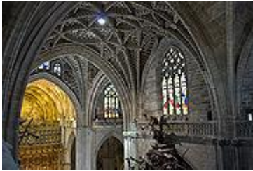
Bóveda del crucero.

La Catedral posee cinco naves que se distribuyen, mirando hacia Levante. No cuenta con una cabecera en el sentido gótico habitual en forma de ábside sin girola, ya que su planta salón es un perfecto rectángulo de 116 metros de largo por 76 de ancho, que se corresponde milimétricamente con la de la alhama .