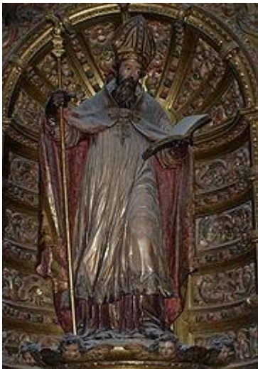
San Leandro en el retablo de la capilla de su nombre.