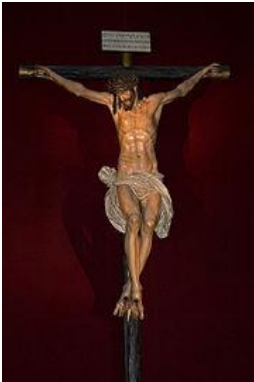
Cristo de la Clemencia.

El elemento artístico más importante de este espacio es sin duda el Cristo de la Clemencia (1603) de Juan Martínez Montañés, también llamado Cristo de los Cálices por el lugar de la catedral en que antes se encontraba, es una obra cumbre de la escultura barroca. Se trata de un bello crucificado que inspira una enorme serenidad. Tiene la particularidad de estar unido a la cruz con 4 clavos en lugar de los 3 habituales.