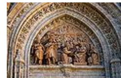
Detalle Puerta de Palos.