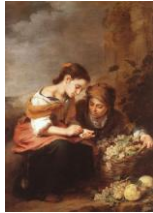
Vendedores de fruta