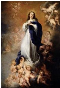
La Virgen de la servilleta

La Inmaculada "monumental" (llamada así por sus enormes dimensiones)