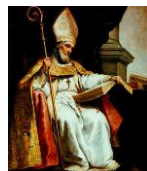
San Isidoro de Sevilla