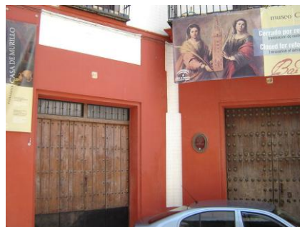
Casa Museo de Murillo en Sevilla.