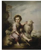
El Buen Pastor