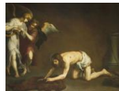
Cristo después de la flagelación