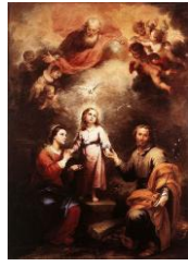
Las dos trinitades

Obras de este periodo expuestas en otros museos