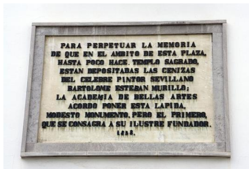
Placa conmemorativa en Sevilla