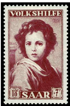
Sello del cuadro "El Buen Pastor"

En honor a este artista que ha dejado al mundo numerosas pinturas, no sólo religiosas, sino también costumbristas, se han bautizado calles, plazas e incluso jardines, se han fabricado sellos en su honor..... Existe en Sevilla una casa museo dedicada a este pintor.