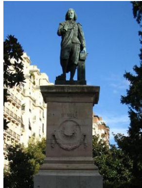
Estatua de Murillo en Madrid

Murillo fue muy querido, tanto en círculos cultos como populares.