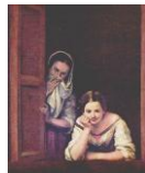
Mujeres en la ventana